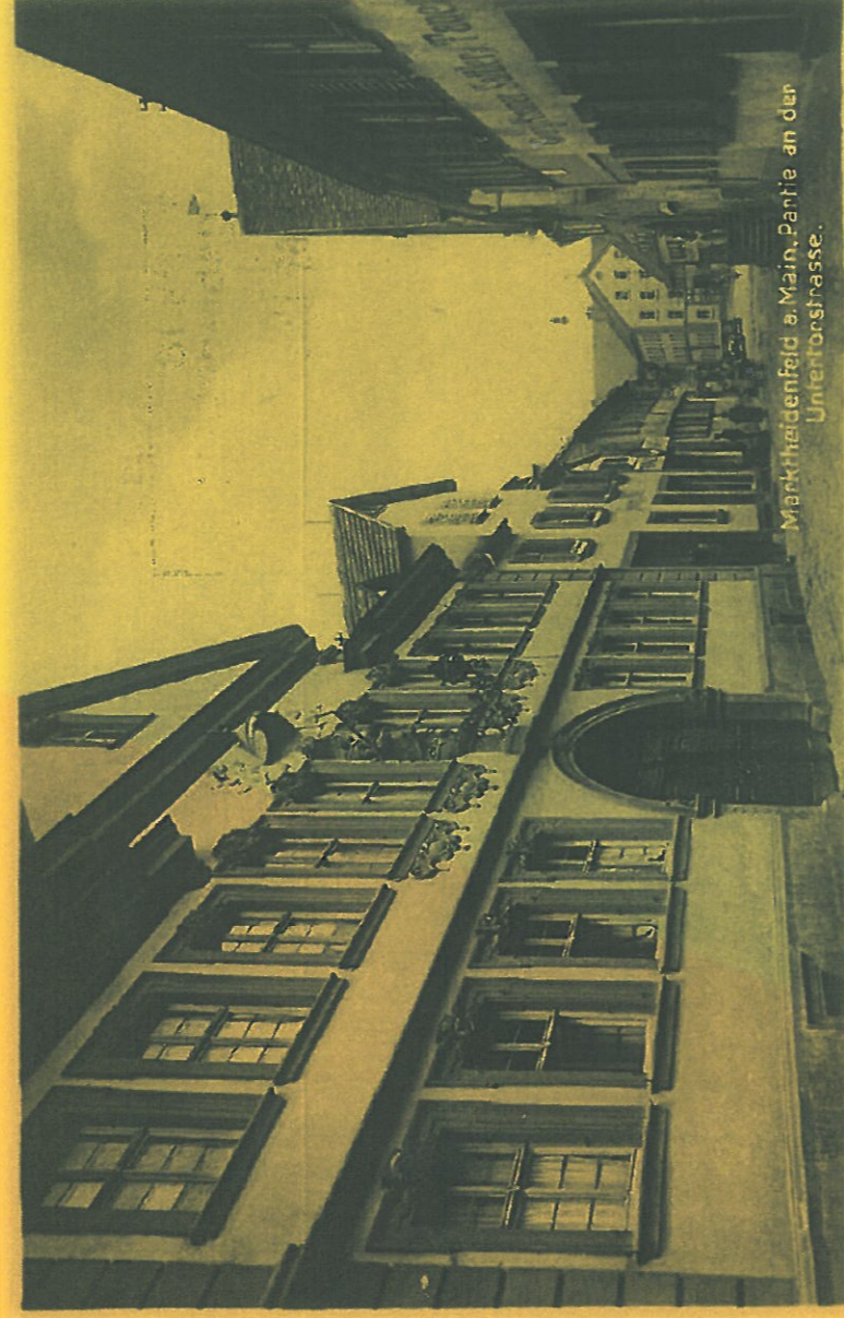
11 Uhr: „Eine blaue Stunde“ - eine Führung durch das Franck-Haus, Untertorstraße 6